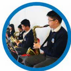
Elementary School Grades 1 to 8