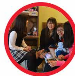
Boarding Program Grades 7 to 12