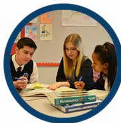
Secondary School Grades 9 to 12