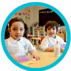
JASX Early Learning Ages 3.8 to 6 years of age

it all comes together in the fifth... that's the Addison Advantage™