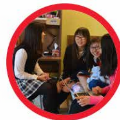
Boarding Program Grades 7 to 12