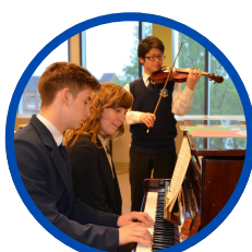
Elementary School Grades 1 to 8