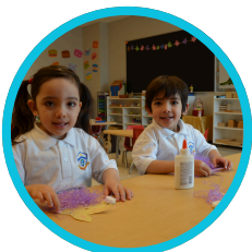
Early Learning Ages 3.8 to 6 years of age

It all comes together in the fifth... that's the Addison Advantage™