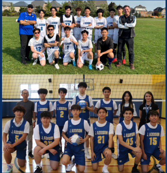
男子足球队和排球队

正如我们强调的那样，高中体育运动是加德生学生发展不可或缺的一部分，为他们应对未来的生活挑战做好准备。