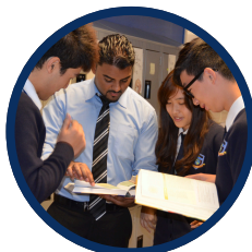
Secondary School Grades 9 to 12