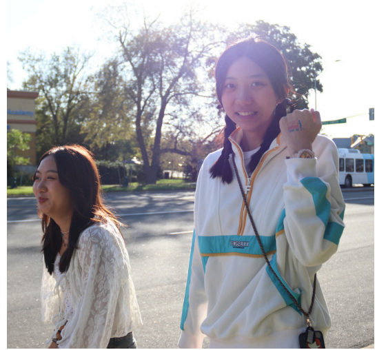
高中特里·福克斯步行/跑步

这项活动不仅为学生提供了保持活跃的机会，还强调了团队合作和同情心的重要性。通过参与，他们学习了坚持不懈和慈善事业的价值观，对社区产生了积极影响，并激励了后代。