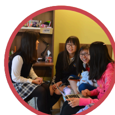
Boarding Program Grades 7 to 12